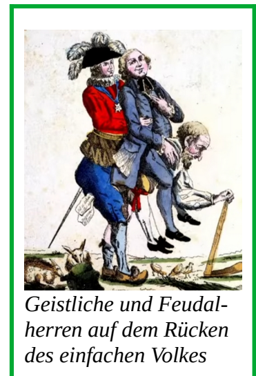
Geistliche und Feudalherren auf dem Rücken des einfachen Volkes

Dann kam die Zeit des Adels samt Königen und Kaiser, die es geschafft hatten, Staaten zu konzentrieren und so den Feudalismus zu beenden. Die französische Revolution markierte den Endpunkt. Hohe Schulden und der Merkantilismus führte dann zu Manufakturen und mit einem hoch gepushtem Geldsystem samt Krediten damit auch zu neuer Infrastruktur.